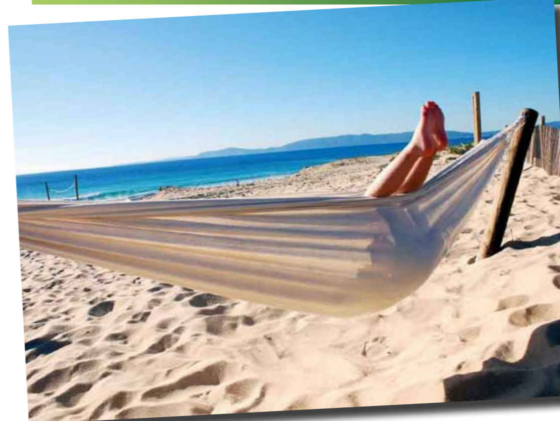
Portugal försöker sedan årsskiftet att locka till sig pensionärer och, kanske framförallt, pensionskapital genom att erbjuda total skattefrihet på tjänstepensionsinkomster.

Det var först under 2010 som Portugal införde nya skatteregler för privata tjänstepensioner för invandrare. Först till sommaren 2011 kommer SCB att ha ny statistik klar som visar om den nya skattemoroten haft någon dragningskraft på svenskarna.